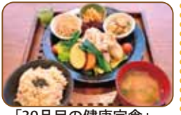
「39品目の健康定食」 ¥895(15:00まで)

<<営業時間>> 月~土：11:30~22:00 (L.O.21:30) 定休日：日曜・祝日 TEL：06-4795-2215