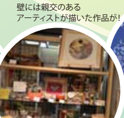
壁には親交のあるアーティストが描いた作品が!