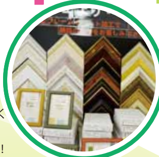
額縁選びはソムリエにおまかせ!

す。カットしたい形状をPCで選択すると、その通りにマシンが動いて切り抜いてくれるんです。 こんなハイテクなマシンがあるんですね! 実際に目の前で加工するところを見せていただきましたが圧巻です!ぜひみなさんも見て確かめてみてください!