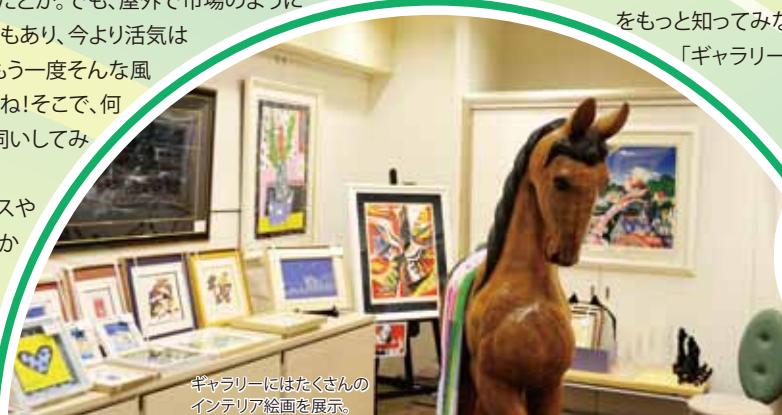
ギャラリーにはたくさんのインテリア絵画を展示。

駅前ビルは大阪らしいパワーが生まれる場所。さて、そんな「ギャラリー39」が第2ビルにオープンしたのは1974年。駅前ビルの歴史にまつわるエトセトラについても語っていただきました。 当時、駅前ビル周辺は再開発が遅れていたため、まるで「陸の孤島」状態だったのだとか。でも、屋外で市場のように各お店が出店することもあり、今より活気はあったそうです。是非もう一度そんな風景を取り戻したいですね!そこで、何か良い案がないかお伺いしてみると... 「外の大階段でプロレスや格闘技をやってみるとか(笑)」 なんと大胆な発想!でも名案(迷案?)かも