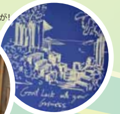
かわいいクラフトもいっぱい!