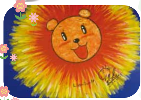
【ギャラリー39】 ギャラリー外壁のアーティストによる作品