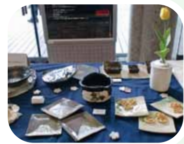
【好陶会】(旧アール・エイチ・ワイ陶芸教室) 3/24に開催した会員さんの作品展示会の様子